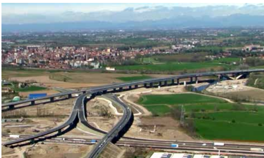
Viadotto Lambro e opere di interconnessione con A1

Entrata in esercizio prevista per maggio per Teem-A58, grazie alla volata finale che ha visto i cantieri aperti anche a Pasqua e Pasquetta lungo tutti i 32 chilometri di tracciato autostradale da Melegnano-Vizzolo ad Agrate-Caponago che risultano interconnessi a sud con l'A1 Milano-Napoli, al centro con Bre-BeMi e a nord con l'A4 Milano-Venezia. La Concessionaria Tangenziale Esterna SpA e il Consorzio Costruttori Teem hanno proseguito i lavori di stesa dell'a-