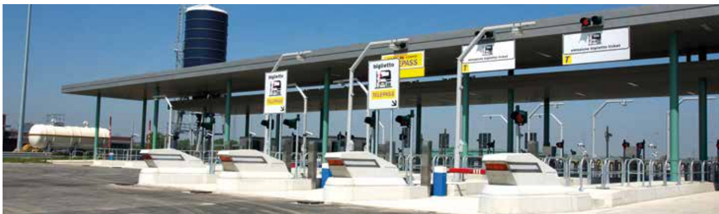
Vista della barriera di Paullo e prove tecniche di illuminazione