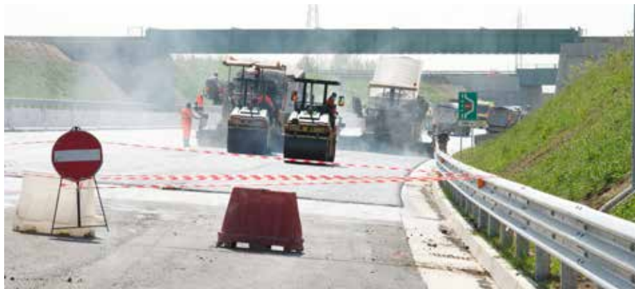
Asfaltatura delle rampe di interconnessione con A1

Sotto Pasqua le lavorazioni si sono concentrate, in particolar modo, sui ritocchi al manto drenante, steso, nei giorni scorsi, anche lungo tutto lo sviluppo del raccordo fra TEEM-A58 e l'A4 Milano-Venezia e sul completamento dei casselli di Gessate e Pessano con Bornago. Ma i tecnici impiegati hanno pure accelerato l'entrata in funzione dei pannelli a messaggio variabile e delle colonnine Sos nonché il collaudo dei chilometri di fibra ottica già posati e degli impianti di rilevamento delle condizioni meteorologiche. È stata riaperta ai ciclisti la pista tra Gorgonzola e Bellinzago chiusa durante la realizzazione della Galleria Martesana, una delle opere più complesse di TEEM-A58.