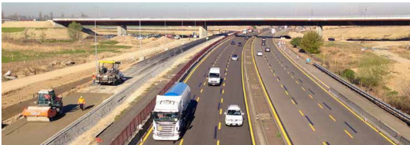
Asfaltatura delle rampe di interconnessione con A1